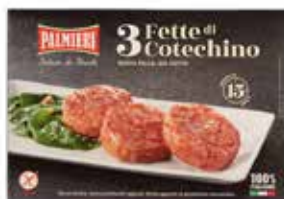
Nome: Cotechino precotto a fette