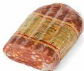
Nome: Spianata Calabra 1/2 S.V. Shelf life: 120 giorni Peso: 1,3/1,5kg