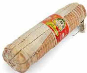
Nome: Pancetta Arrotondata con cotenna Stagionatura: 3/4 mesi Peso: 5,2/5,6kg