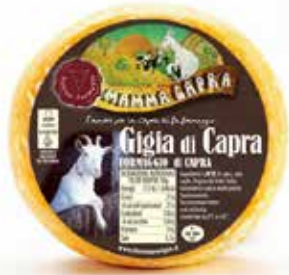
Nome: Giglia di Capra Shelf life: 25 giorni Peso: 300gr