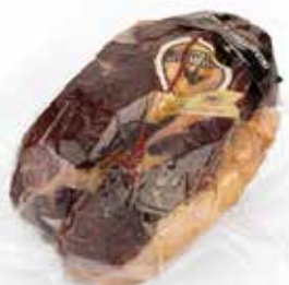
Nome: Culatello di Zibello DOP pronto taglio Stagionatura: 22/24 mesi Peso: 4,2/4,6kg