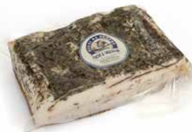
Nome: Lardo Stagionato con Rosmarino trancio Stagionatura: 90 giorni Peso: 2,3/2,5kg