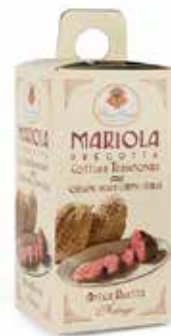
Nome: Mariola Peso: 500g