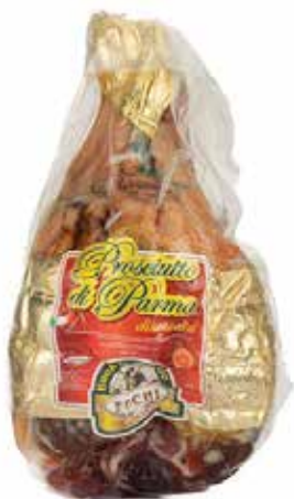
Nome: Prosciutto Crudo di Parma disossato Stagionatura: 20/22 mesi Peso: 8,3/8,5kg