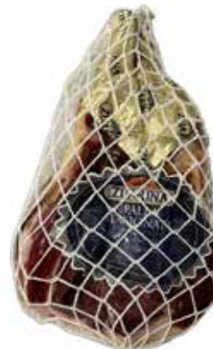
Nome: Spalla Stagionata Zuarina Stagionatura: 12/14 mesi Peso: 6,9kg