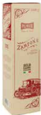
Nome: Zamponi Peso: 1kg