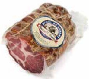
Nome: Coppa di Parma 1/2 Stagionatura: 3/4 mesi Peso: 0,9/1kg