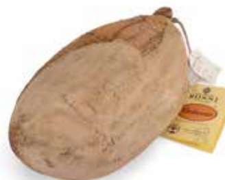
Nome: Culaccia Originale Stagionatura: 18 mesi Peso: 5,6/6kg