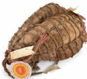
Nome: Culatello di Zibello DOP Stagionatura: 17/24 mesi Peso: 4,8/5,5kg