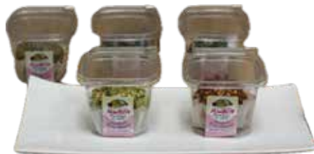
Nome: Mini Bon Shelf life: 15 giorni Peso: 80gr