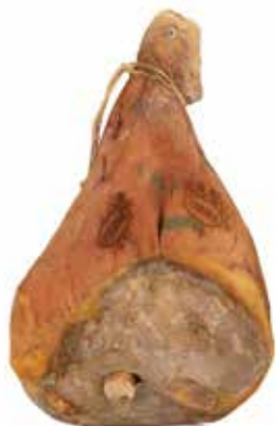
Nome: Prosciutto Crudo di Parma Stagionatura: 24/27 mesi Peso: +11kg