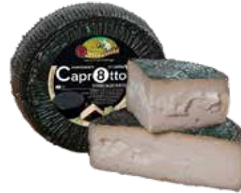
Nome: Formaggio Capr8tto Stagionatura: 60 giorni Peso: 2,2kg