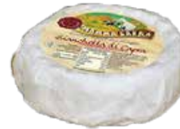
Nome: Bianchetta di Capra Shelf life: 25 giorni Peso: 250gr