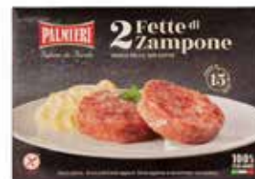
Nome: Zamponi precotto a fette