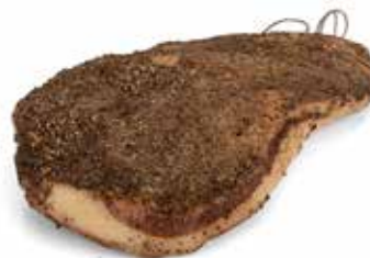
Nome: Guanciale per Amatriciana Stagionatura: 60 giorni Peso: 2,5/2,8kg