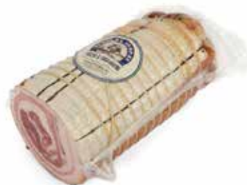
Nome: Pancetta Arrotondata con cotenna 1/2 Stagionatura: 3/4 mesi Peso: 2,6/2,8kg