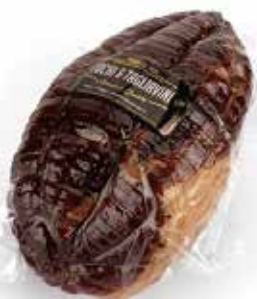
Nome: Culatello di Parma pronto uso Stagionatura: 16/18 mesi Peso: 4,2/4,5kg