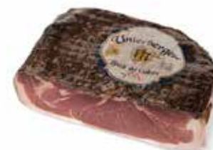
Nome: Speck del Cadore Stagionatura: 5 mesi Peso: 2,3/2,5kg