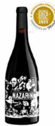
Nome: Nazarin 100% Grenache Formato: 0,750l