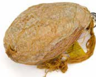
Nome: Culatta Stagionata Stagionatura: 16/18 mesi Peso: 5,6/6kg