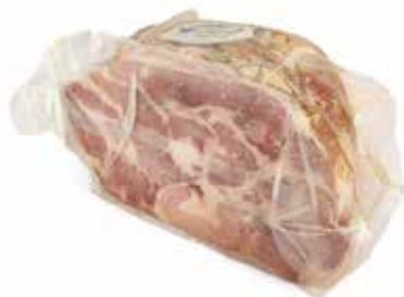
Nome: Spalla Cotta di S. Secondo 1/2 Peso: 4,4/4,6kg