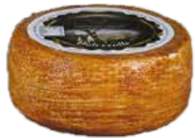
Nome: Dolcevalle Stagionatura: 45 giorni Peso: 1,1kg