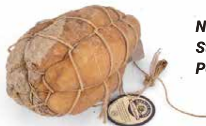
Nome: Fiocco di Prosciutto in budello Stagionatura: 10/12 mesi Peso: 2/2,3kg