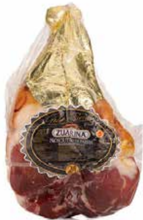
Nome: Prosciutto di Parma disossato Stagionatura: 24/30 mesi Peso: 8,3/9kg