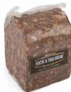
Nome: Cicciolata con c/ciccioli trancio Peso: 2,3/2,6kg