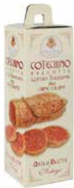
Nome: Cotechino Peso: 500g